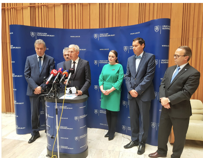
Tlačový brífing po skončení zasadnutia HSR SR