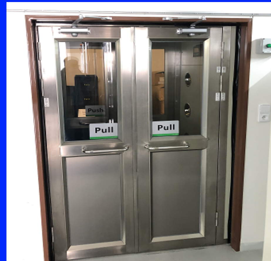
2x clean room ISO 6