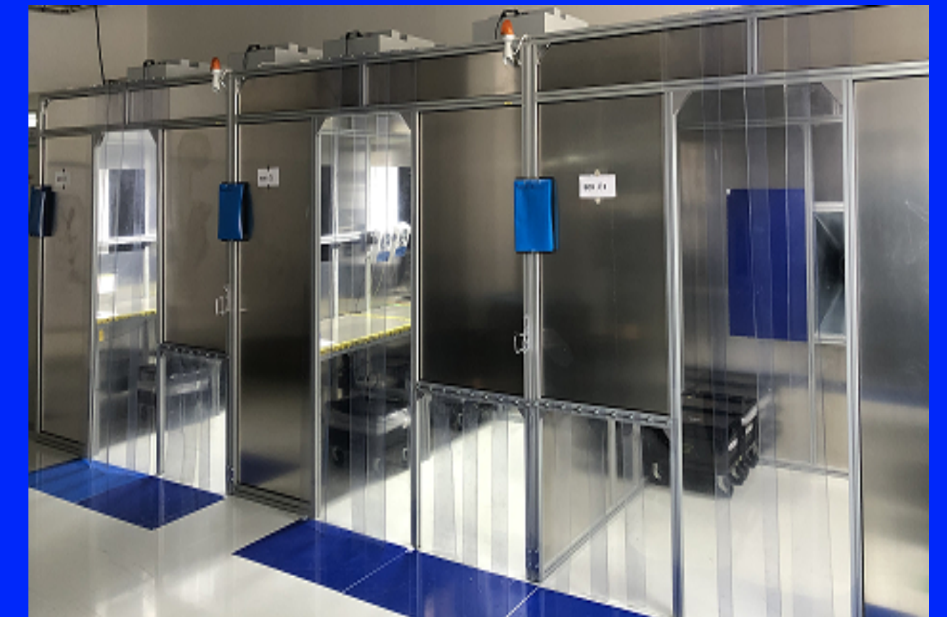
3x clean room ISO 7