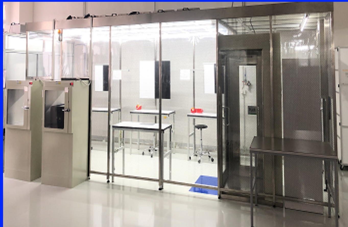
1x clean room ISO 5